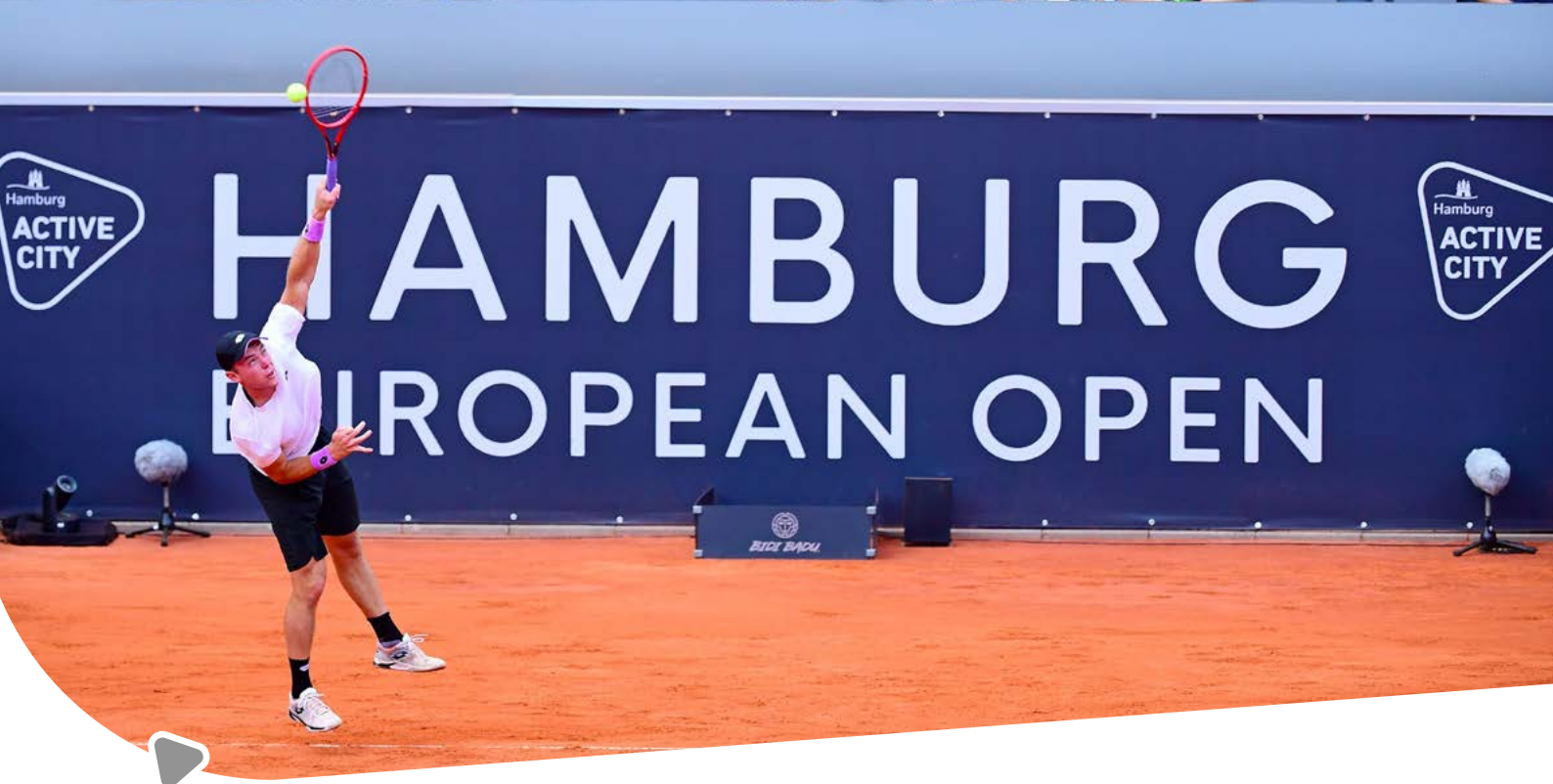
Tennis am Rothenbaum

reichbar. So besteht die Möglichkeit, hautnah und kostenfrei die sportliche Faszination in all ihren unterschiedlichen Facetten und Leistungsklassen zu vermitteln beziehungsweise zu erleben. Vor diesem Hintergrund sind Veranstaltungen wie der „Haspa Marathon Hamburg“, der „Hamburg Wasser World Triathlon“, der „IRONMAN HAMBURG“ und die „BEMER Cyclastics“ wichtig für Hamburg und die Sichtbarkeit der Active-City-Philosophie.