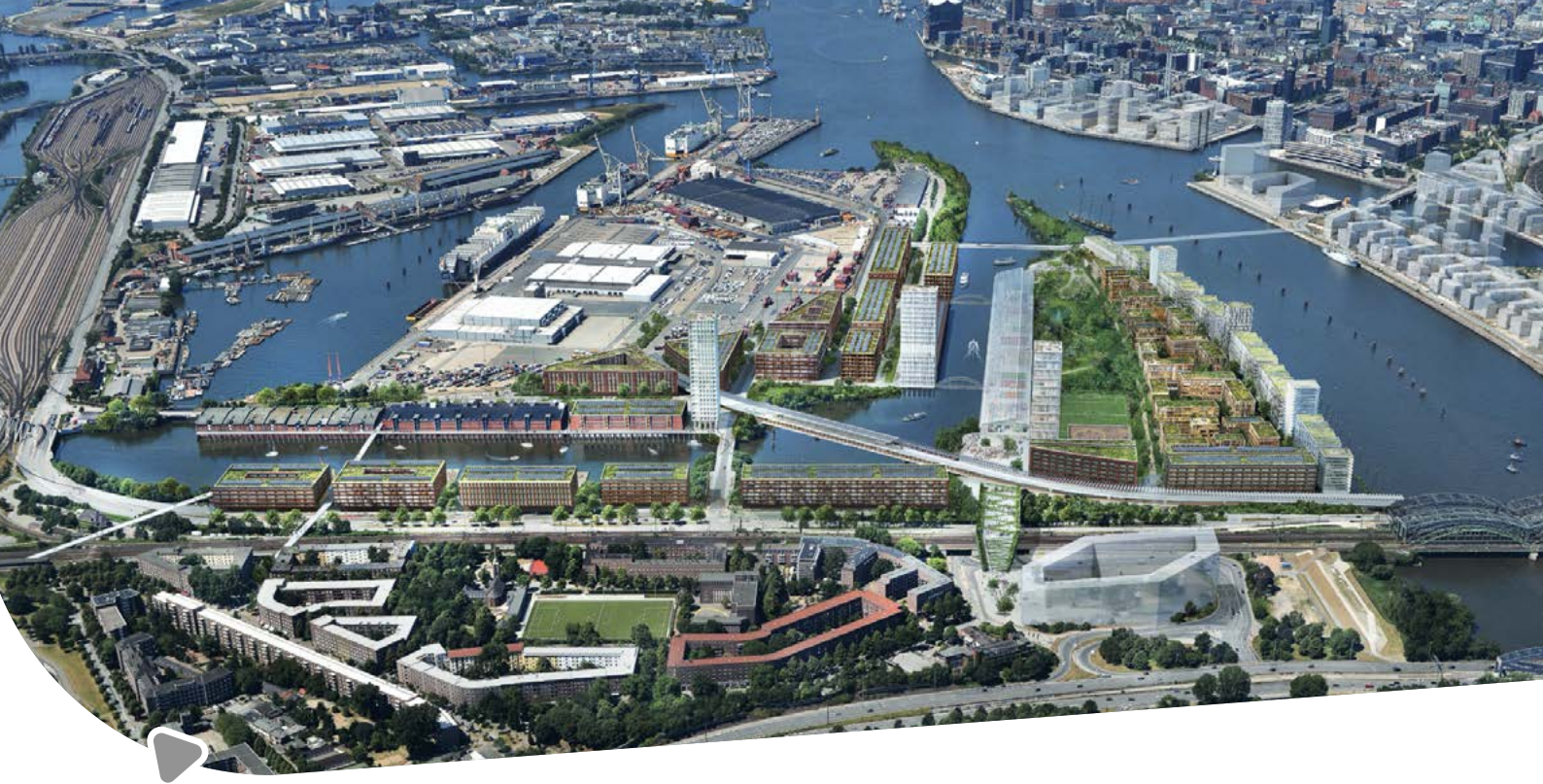
Leitidee Entwicklung Grasbrook