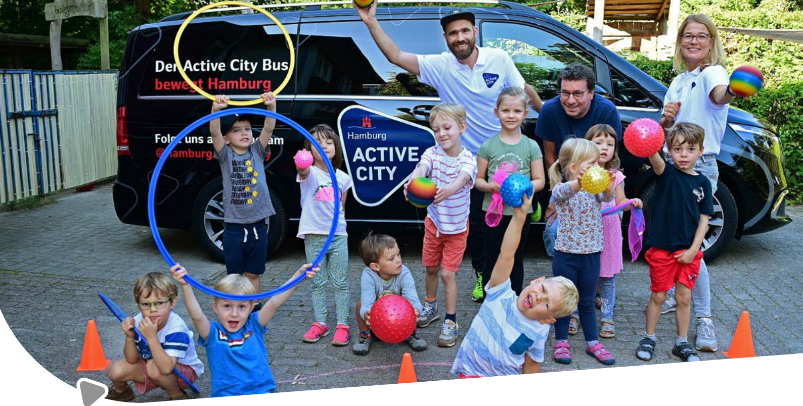
Active City Bus

Unterstützung im Bereich Nachhilfe, um Fehlzeiten ausgleichen und wieder Anschluss an den Lehrplan erreichen zu können.