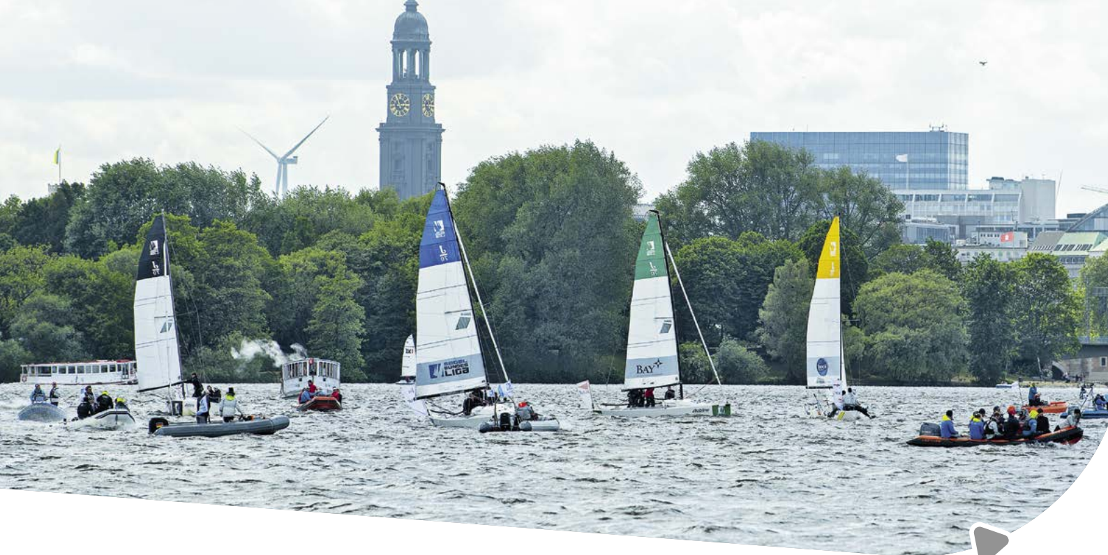
Segel-Bundesliga auf der Alster

also der Verfolgung eines Ansatzes, nach dem eine Sportanlage so angelegt wird, dass sie für möglichst viele Sportarten nutzbar ist (wie bereits im Rahmen der Planungen zum „Active City“-Modellstadtteil Oberbillwerder).