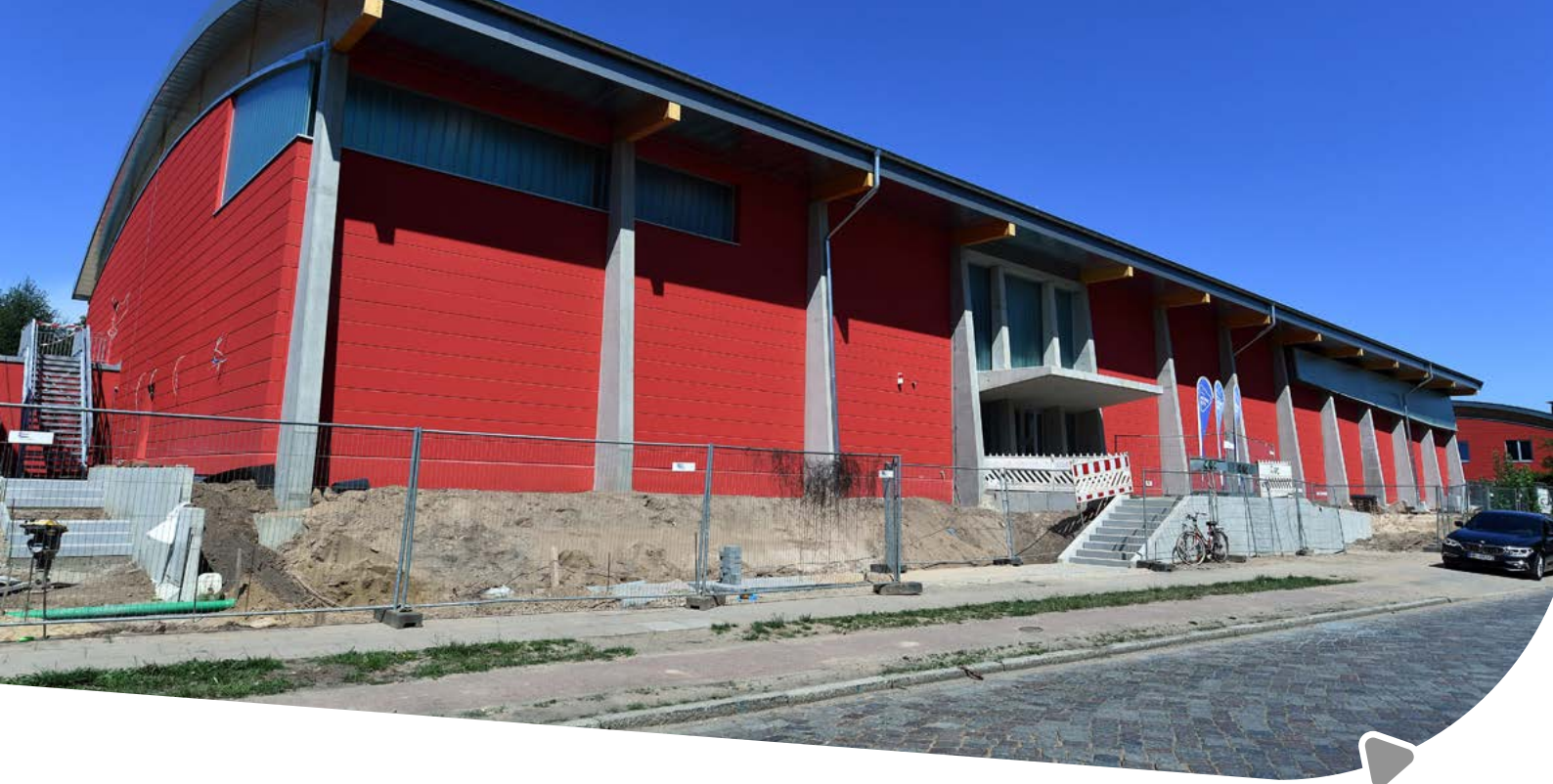
Handball-Judo-Halle am OSP

in Universitätsnähe nutzt, werden am Hemmingstedter Weg in Altona moderne Spielfelder und ein Funktionsgebäude mit Büros, Trainings- und Besprechungsräumen entstehen. Von diesen Maßnahmen profitieren die Spitzensportlerinnen und -sportler ebenso wie die Nachwuchstalente im Rudern und Hockey.