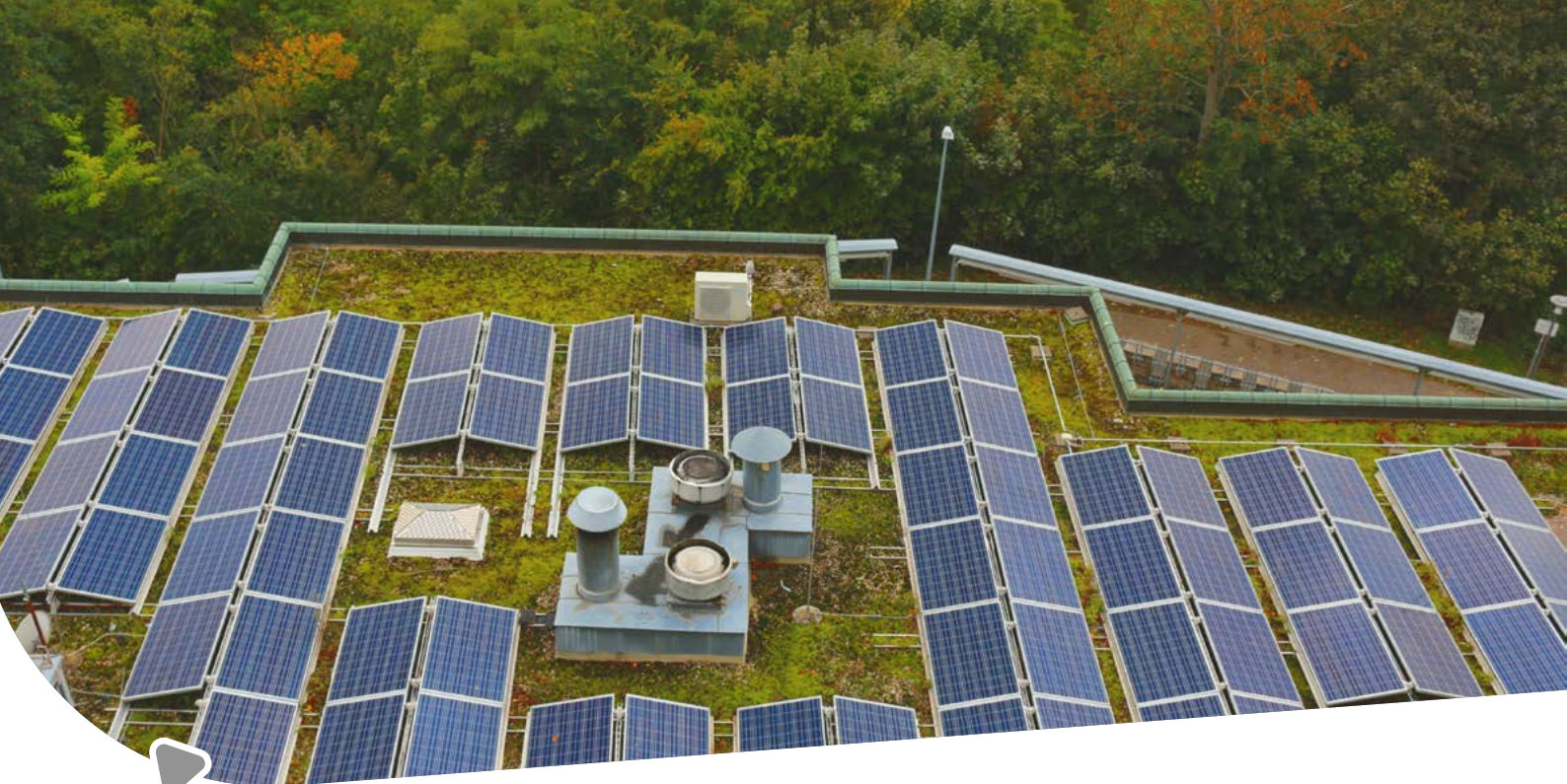
Gründach mit Photovoltaik-Anlage

40-Standard errichtet und bei Sanierungen im Durchschnitt Effizienzgebäude-70-Niveau erreicht. Die Energieversorgung erfolgt dabei weitgehend aus erneuerbaren Quellen.