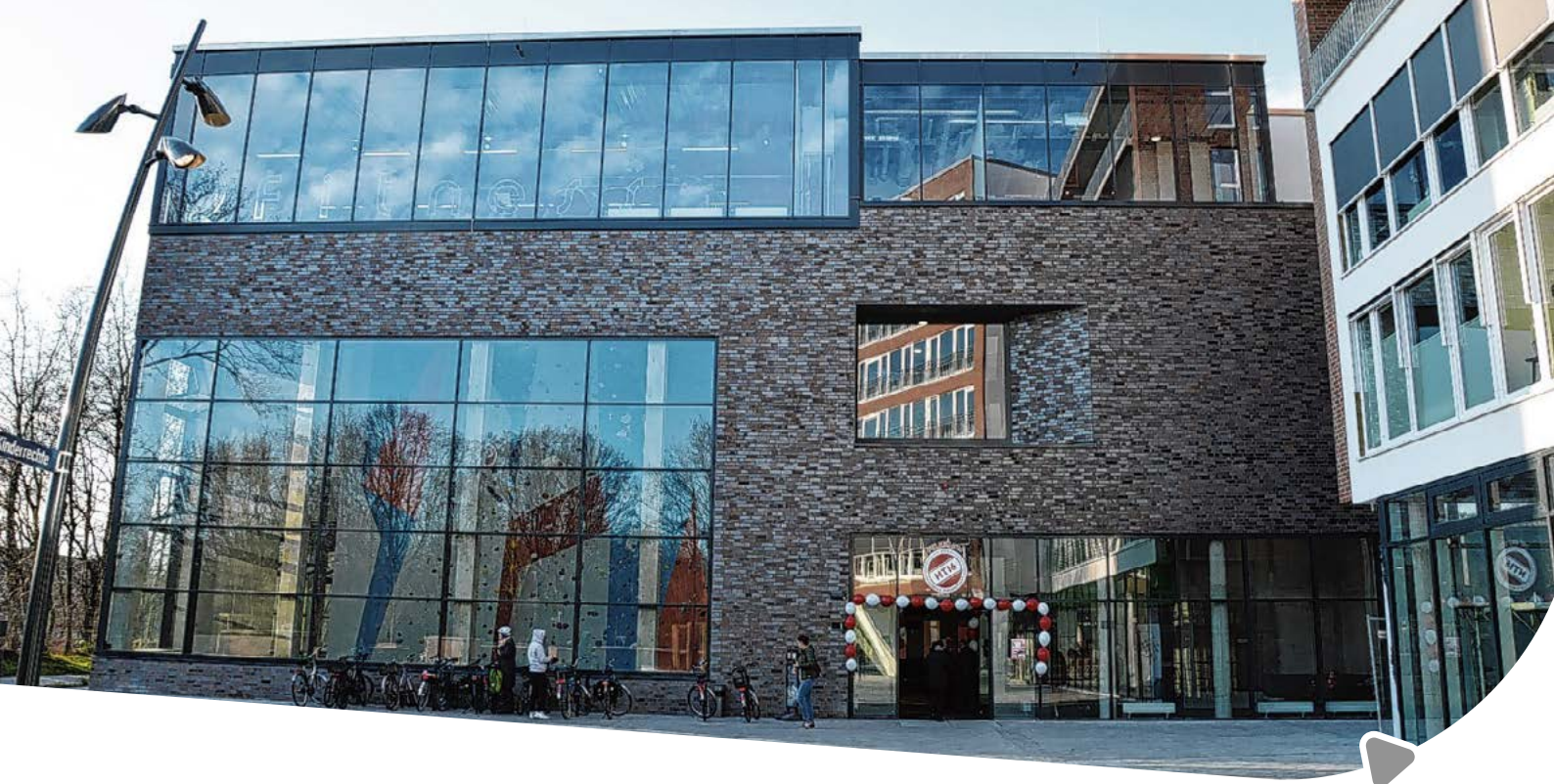
HT 16 Sportzentrum

von Grün- und Wegeflächen eine immer größere Rolle bei der Stadtteilentwicklung. Zusätzliche Instrumente wie die institutionelle Beteiligung des Sports in Planungsverfahren und im Nutzerbeirat Schulsportanlagen oder die Etablierung professioneller städtischer Trägerinnen und Träger für Realisierung und Betrieb von Sportinfrastruktur sichern eine hohe sportseitige Beteiligungs- und Umsetzungsqualität.