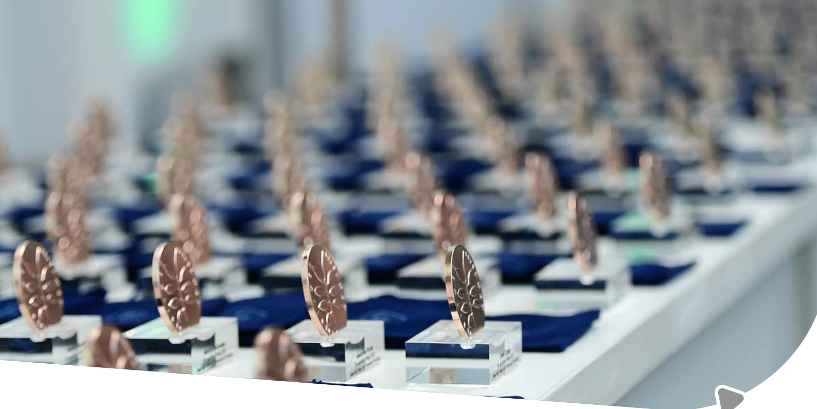
Hamburger Medaille für sportliche Erfolge

mate werden fest etabliert und weiterentwickelt. Ihre Bekanntheit in der Hamburger Bevölkerung und ihre Attraktivität werden weiter erhöht.