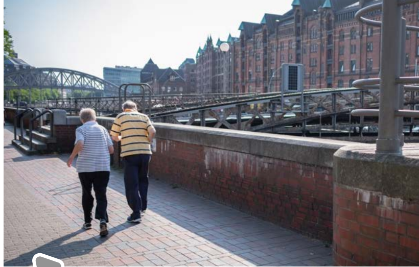
Sport in der Speicherstadt