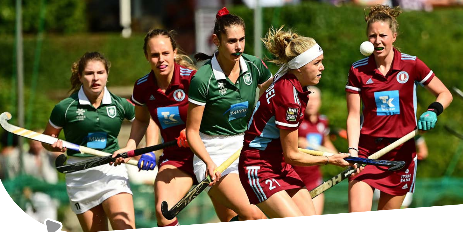
Hockey Bundesliga Damen

Kerngedanke der Active-City-Philosophie ist es, mit einem Angebot für alle möglichst viele zu erreichen. Sport- und Bewegungsangebote sollen für alle Hamburgerinnen und Hamburger attraktiv und niedrigschwellig zugänglich sein. Es muss leichtfallen und Spaß machen, Sport zu einem alltäglichen Bestandteil des eigenen Lebens zu machen. Im Sinne einer inklusiven Strategie soll die Active City allen ein aktives Leben ermöglichen, unabhängig von Alter, Geschlecht, individueller Beeinträchtigung, Herkunft oder sozialem Hintergrund. Erforderlich ist dafür ein breites und vielfältiges Bewegungsangebot für alle, das gerade auch sportferne Bevölkerungsgruppen einbezieht und gezielt anspricht.