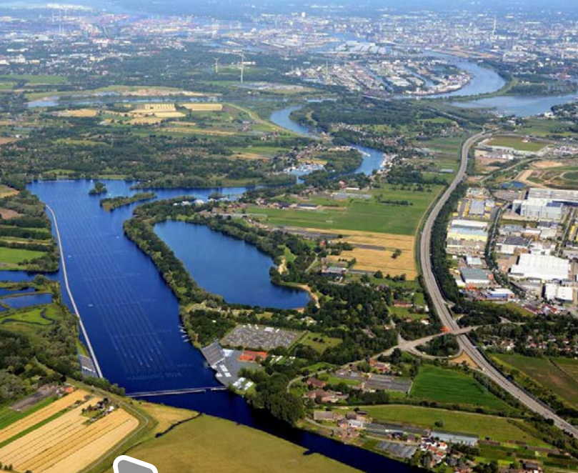
Regattastrecke Dove Elbe

Die Weltspitze rückt in vielen Sportarten auf höherem Leistungsniveau immer enger zusammen, sodass größere Anstrengungen und kontinuierlich optimierte Trainingsbedingungen nötig sind, um sich an der Spitze zu behaupten beziehungsweise sie zu erreichen. Das leistungsgerechte Training beginnt dabei in vielen Sportarten immer früher und muss bereits in den Schulalltag integriert werden, um im Erwachsenenalter konkurrenzfähig zu sein.