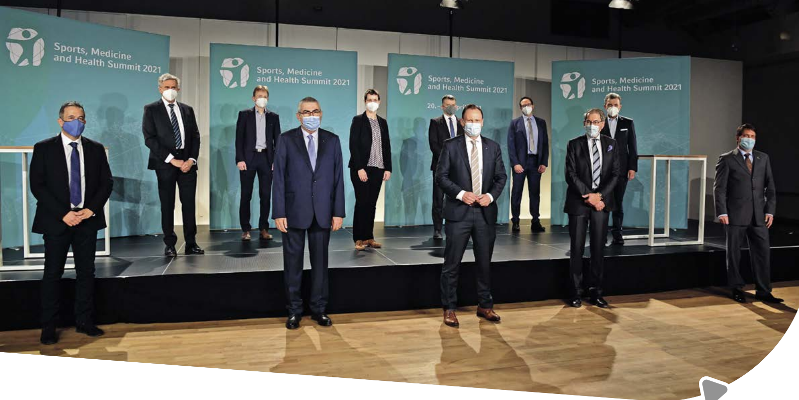
Sports, Medicine and Health Summit

Mit dem Sports, Medicine and Health Summit , der 2021 erstmals stattgefunden hat und für 2023 und die Folgejahre wiederum in Hamburg durchgeführt werden soll, soll ein internationaler, in seiner Interdisziplinarität einzigartiger Kongress in der Stadt etabliert werden, der die Themenfelder Sport- und Bewegungswissenschaft sowie Sportpraxis auf einem neuen Niveau zusammenführt.