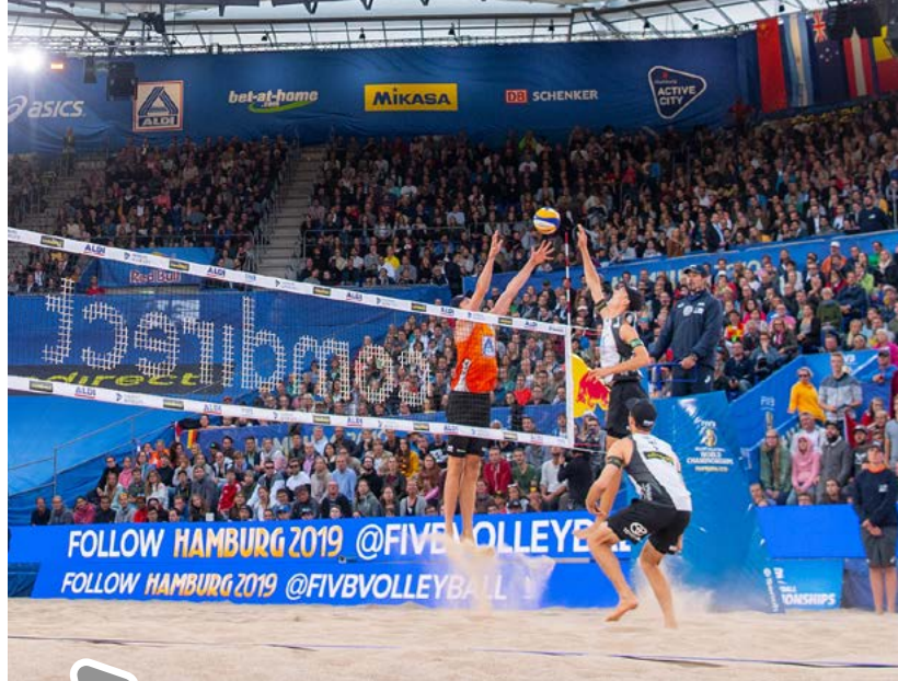
Beachvolleyball am Rothenbaum

die internationale Konkurrenz bestehen zu können und idealerweise auch Maßstäbe zu setzen.