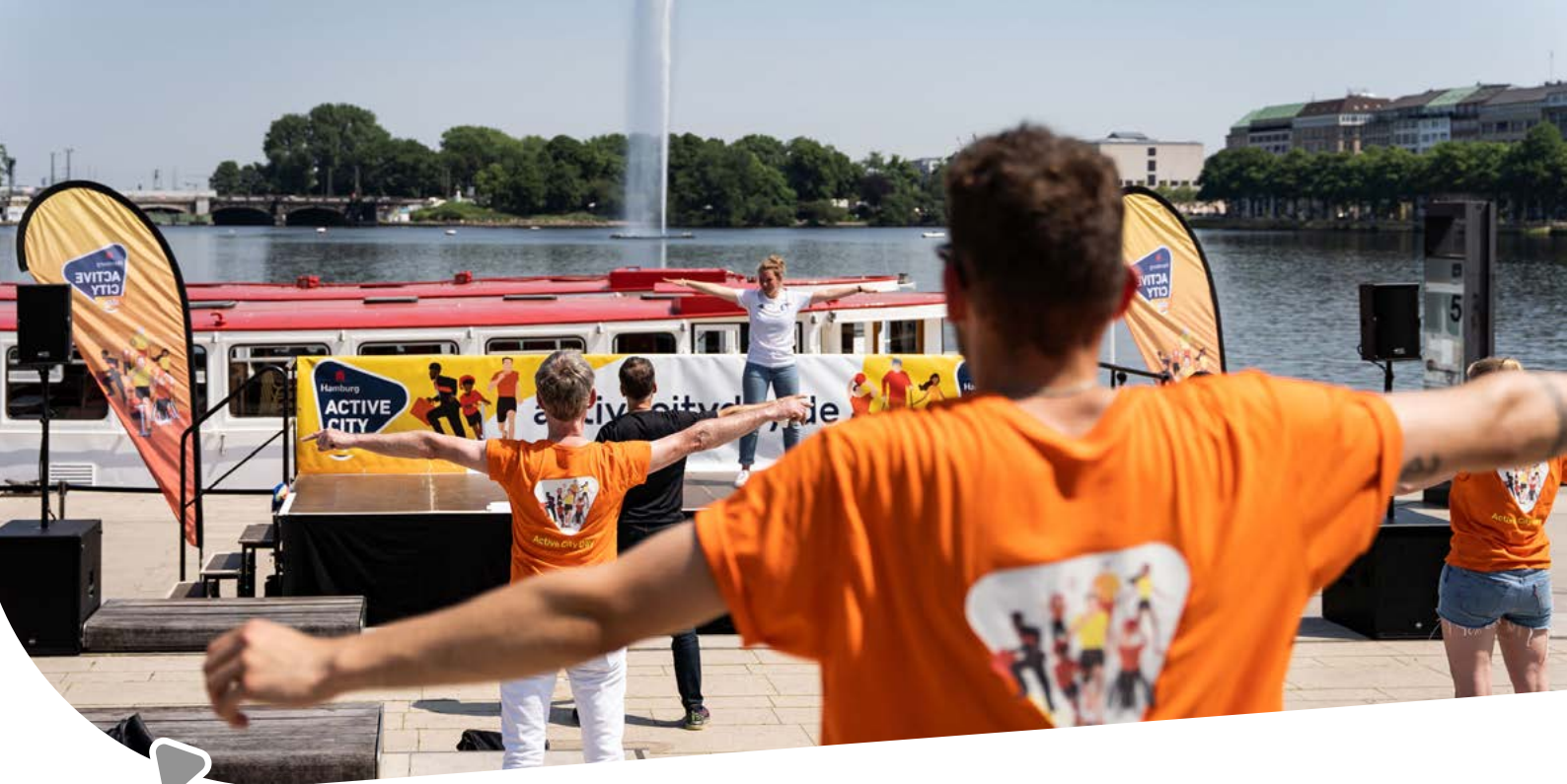
Active City Day

stärkt, neue Berührungspunkte sollen geschaffen werden. Dabei spielen Sportveranstaltungen eine wichtige Rolle, unabhängig davon, ob es sich um internationale Großveranstaltungen oder Wettbewerbe im Stadtteil handelt. Denn sie machen den Sport mit seinen Facetten in der Stadt präsent und animieren Menschen, sportlich aktiv zu werden.